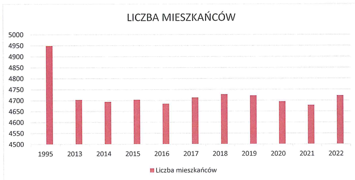
Wykres 1. Liczba mieszkańców Gminy Mniszków

Powyższy wykres przedstawia liczbę mieszkańców gminy w ostatnich latach w porównaniu do roku 1995.