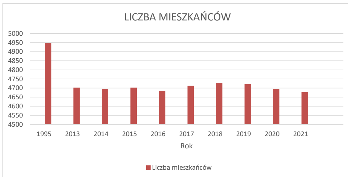
Wykres 1. Liczba mieszkańców Gminy Mniszków

Powyższy wykres przedstawia liczbę mieszkańców gminy w ostatnich latach w porównaniu do roku 1995.